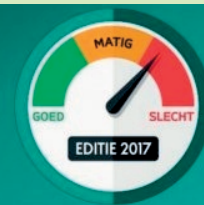
Impact socio-économique de trois ans de gouvernement Michel